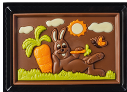
CHOKLADASK KANIN MED MOROT

ART.NR: 10059 FÖRP: 1x85 g. TRP.FÖRP: 8x85 g.