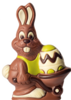
KANIN MED SKOTTKÄRRA

ART.NR: 10071 FÖRP: 1x75 g. TRP.FÖRP: 10x75 g.