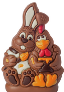
KANIN OCH HÖNA

ART.NR: 10038 FÖRP: 1x150 g. TRP.FÖRP: 6x150 g.