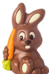
KANIN MED MOROT

ART.NR: 10255 FÖRP: 1x40 g. TRP.FÖRP: 12x40 g.