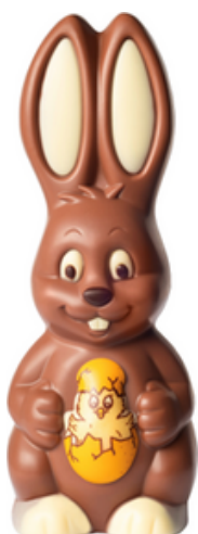
KANIN MED KYCKLING

* Vi reserverar oss för slutförsäljning av säsongprodukterna.