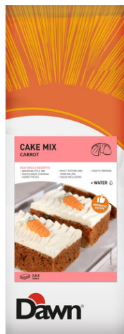
MOROTSKAKMIX ART.NR: 270319 FÖRP: 1x3,5 kg.