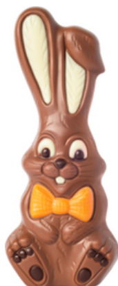
KANIN MED LÅNGA ÖRON

ART.NR: 10257 FÖRP: 1x50 g. TRP.FÖRP: 12x50 g.