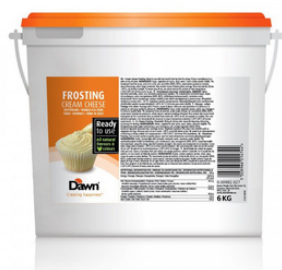
CREAM CHEESE FROSTING SG ART.NR: 270554 FÖRP: 1x6 kg.

"Supersaftig kaka med den rätta smaken!"