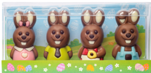
CHOKLADASK PÅSKFIGURER MINI

ART.NR: 10241 FÖRP: 4x10 g. TRP.FÖRP: 9X4X10 g.